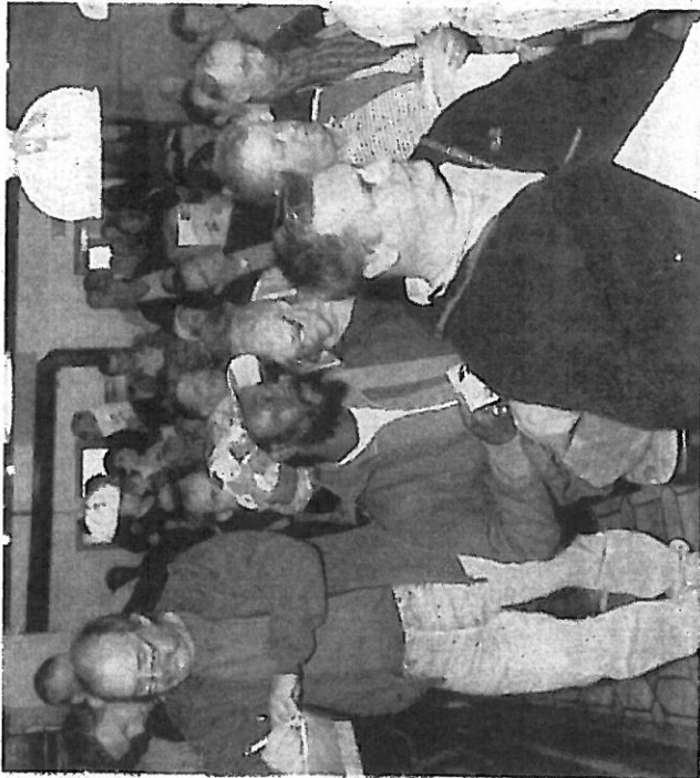
Zahlreich kamen die Interessenten nach Buch.